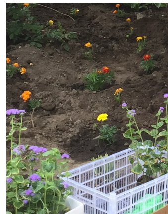
Через несколько недель цветы разрастутся и встретят 1 сентября в пышном цвету.