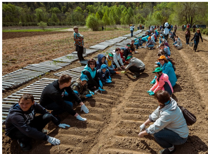
Участники акции готовы к посадке семян сосны кедровой.