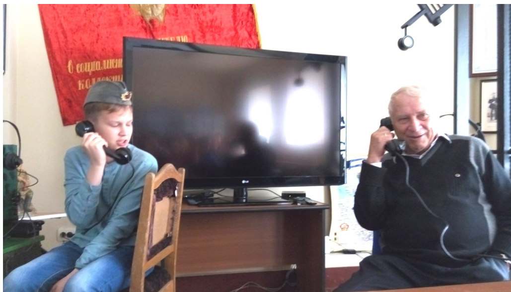
Всем понравилась игра в телефонистов: «Высылайте подкрепление нашему батальону!»

Под конец пришкольного лагеря нас ждало ещё одно необычное событие. Казалось бы, вот чем удивить детей, у которых есть всё? Но нас удивили. Мы пришли в музей связи и своими глазами увидели, чем жили люди прошлого века