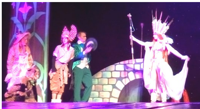
Каждый момент спектакля был очень интересен

Софья Добровольская, 6В